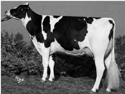
Barbiselle Spring 306 Italy