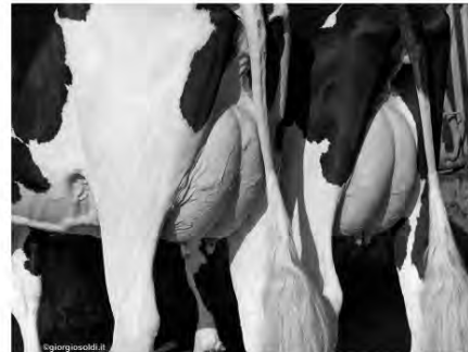
Barbiselle Spring 306 & 351 Italy