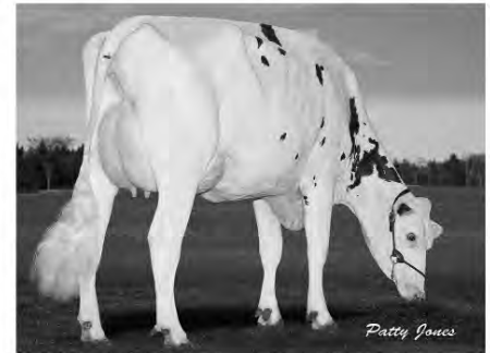
Midlee Spring Falsetto Midlee Farms Ltd.; Osgoode, ON