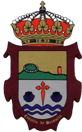
Concello de Boimorto