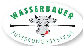
Arrimadores de comida